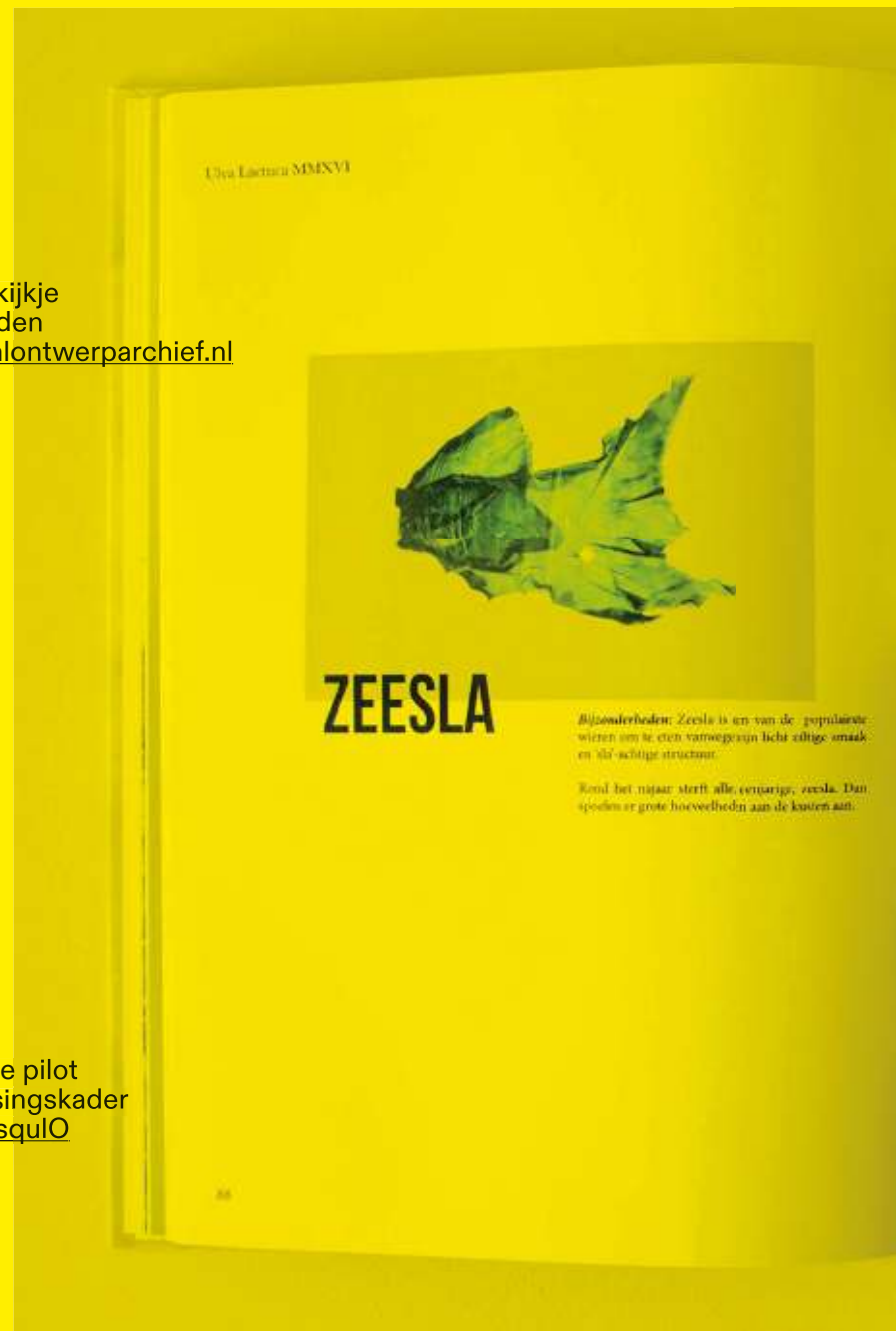
Seaweed Research boek, Studio Nienke Hoogvliet

Lees over de pilot en het toetsingskader ↳ bit.ly/3ysqulO